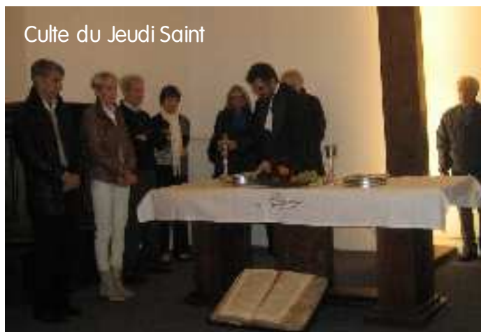
Culte du Jeudi Saint