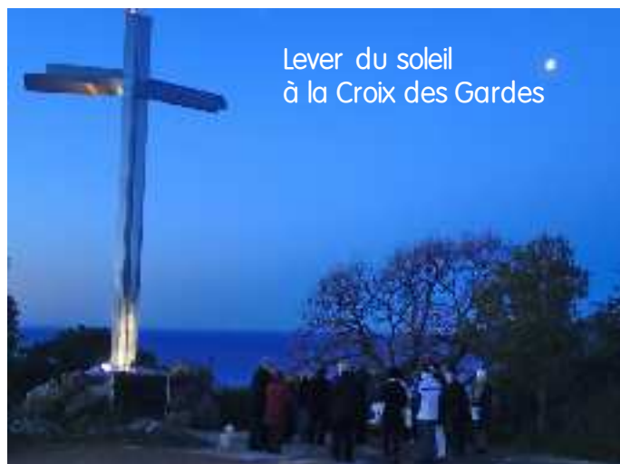
Lever du soleil à la Croix des Gardes